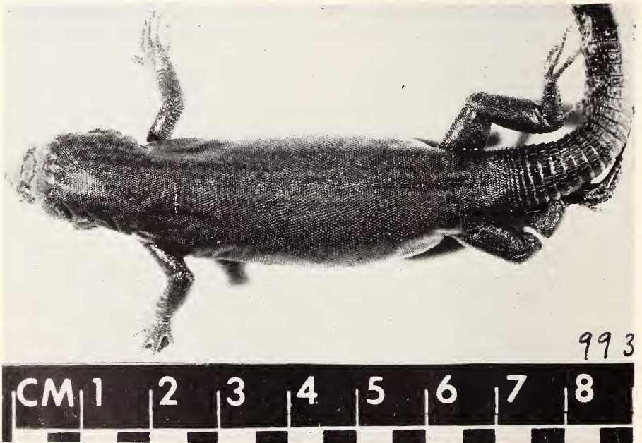
Fig. 11. AS 9937. Isla Esponja. Holotipo de Lacerta lilfordi espongicola .